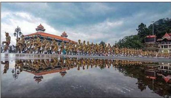
Marching contingent of police force during the full dress rehearsal for the 73rd Independence Day parade, at Ridge in Shimla.

Rain Fury: Death Toll Rises To 86, 61 Still Missing In Kerala Thiruvananthapuram: The death toll in rain-related incidents, floods and landslides rose to 86 in Kerala even as 61 people are still missing in various districts since August 8 in the State. As many as 2,24,506 people from 68,098 families are staying in 1,243 relief camps in various districts, even as several people returned to their homes after water receded at their places. Official sources said here on Tuesday. Sources said two