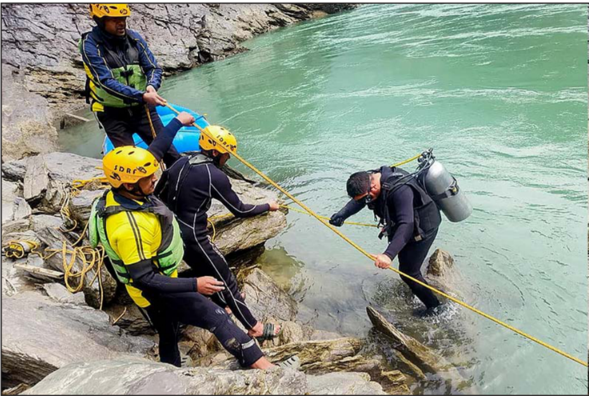
SDRF personnel conduct a search operation after a pickup vehicle reportedly fell into a river, in Tehri Garhwal district, Uttarakhand.