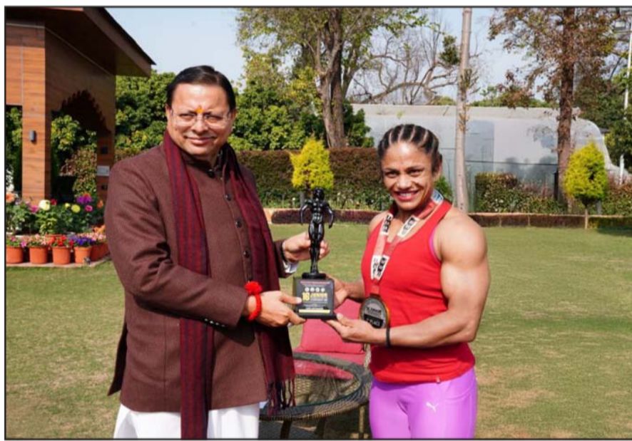
Uttarakhand have guided the nation and the world in environmental conservation, social service, sports, and good governance. We are proud of our women's power. He further stated that talented women in the state who are achieving remarkable success in various fields will also be given opportunities in government service so they can become sources of inspiration for society.

He also added that the land of Uttarakhand has traditionally been matriarchal, and women of the hills have been the backbone of agricultural, social, and cultural life. From time to time, women of